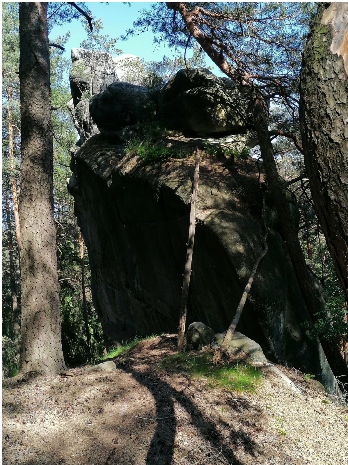
Obrázek č. 1/1