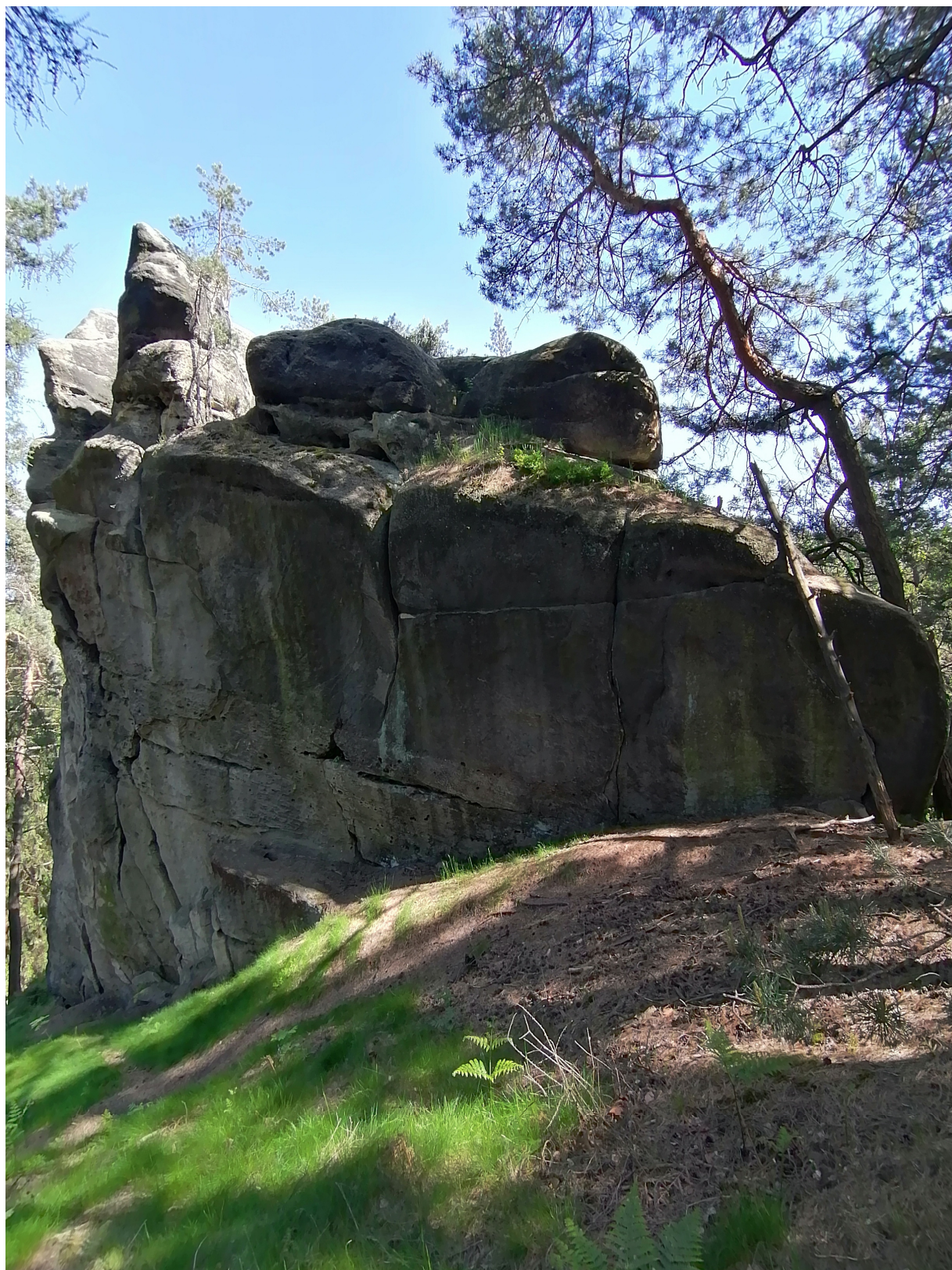
Obrázek č. 1/2