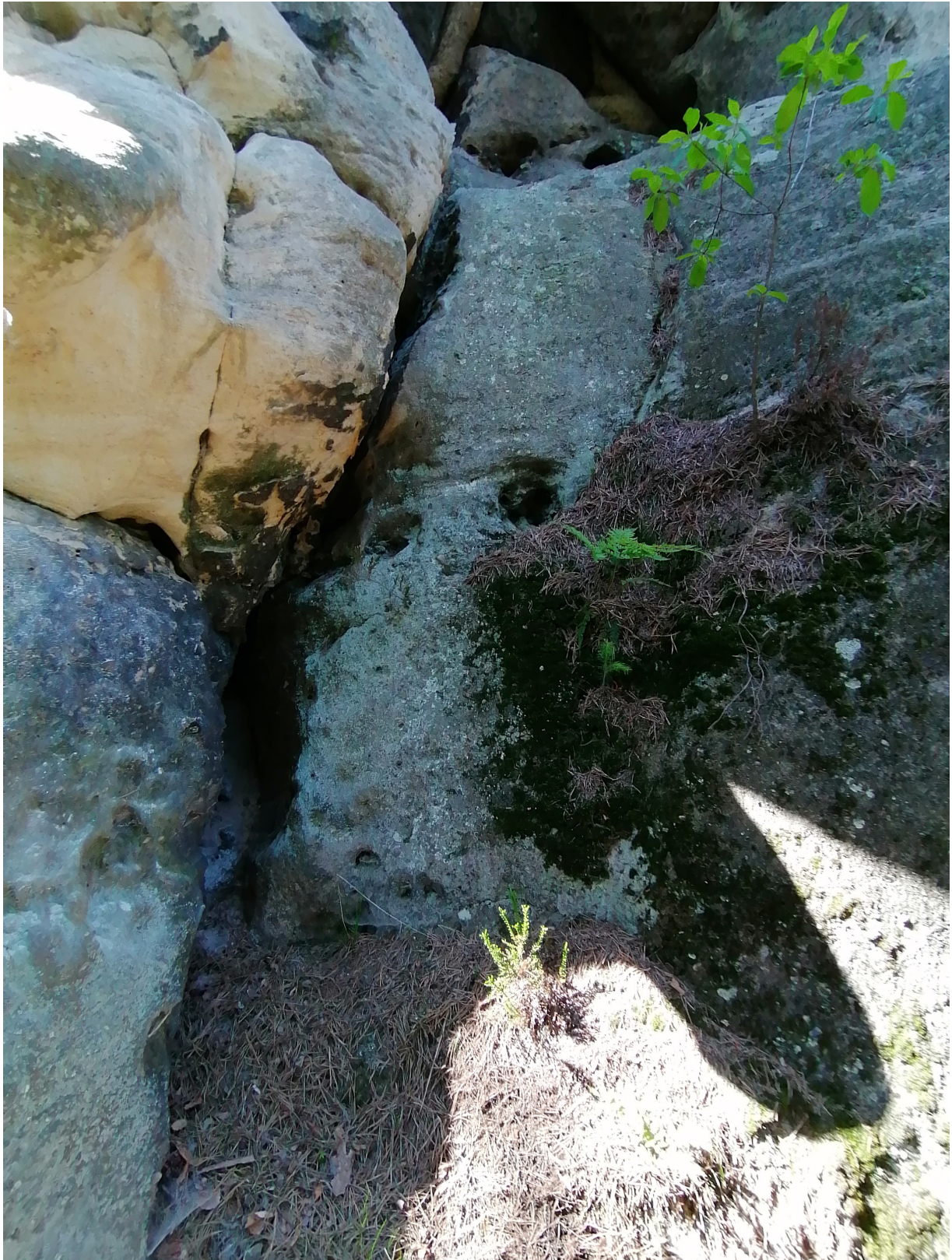
Obrázek č. 1/2